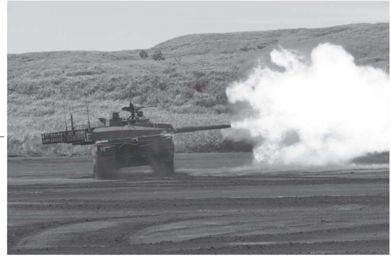
16 MCV

第5・第12旅団の機動化改編 陸上自衛隊は「平成26年度以降に係る防衛計画の大綱(以下「大綱」とし、及び「平成31年度以降に係る防衛計画の大綱」について「30大綱」に基づき、約半数の師団及び旅団の機動師団(旅団)化を推進してきたが、3月第5旅団(甲斐)及び第12旅団(相馬原)の機動化改編が終了し、30大綱別表に示された3個機動師団(第2・第6・第8師団)4個機動旅団(第5・第11・第12・第14旅団)1個機動甲師団(第7師団)1個空挺団(第1空挺団)1個水陸機動団(水陸機動団)及び1個ヘリコプター団(第1ヘリコプター団)からなる「機動運用部隊」が完成した。 電子戦隊の改編 令和3年度末に陸上総隊隷下部隊に新編された電子戦隊(朝霞)の一部が、高田、米子及び川内駐屯地に新編された。 電子戦隊の改編 令和3年度末に陸上総隊隷下部隊に新編された電子戦隊(朝霞)の一部が、高田、米子及び川内駐屯地に新編された。 奄美駐屯地、宮島駐屯地、石垣駐屯地及び与那国駐屯地業務隊の新編 (第7師団)1個空挺団(第1空挺団)1個水陸機動団(水陸機動団)及び1個ヘリコプター団(第1ヘリコプター団)からなる「機動運用部隊」が完成した。