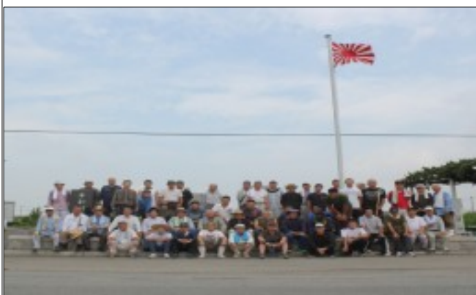
鶉野・平和記念碑苑で全員集合