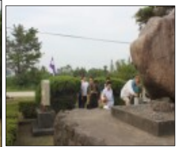
廠舎東慰霊碑清掃