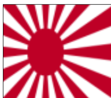
曹友会に対し支部長御礼