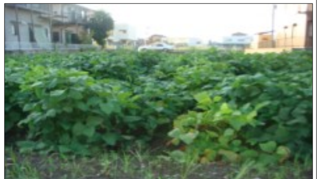
本年8/30の黒豆作柄の現況