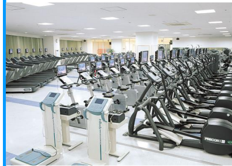
気軽に取り組めるマシン