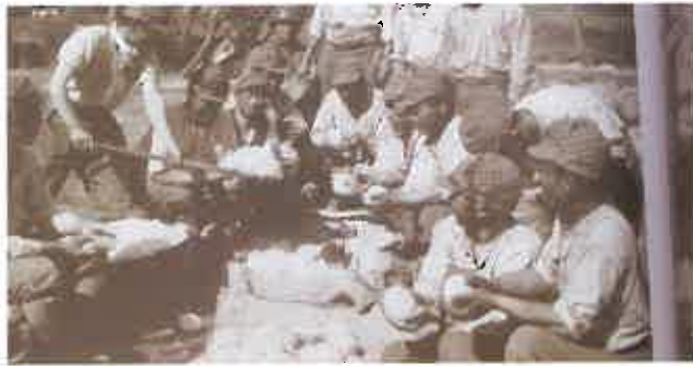
支那事変の最中、上海付近での食事準備風景(昭和12年10月)

その点日本人は明治以来食事には注文が多く、とくに陸軍は統率上兵士の苦情には部隊長も気を使った。陸軍が脚氣予防の麦飯の効用を知りながら常食に取り入れられなかったのはその